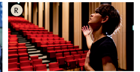
R der Schauspieler, die Schauspielerin

e Sammelt alle Rätsel in der Klasse, mischt sie und verteilt sie neu. Jede Person bekommt drei Rätsel. Arbeitet zu zweit und erratet die Berufe.