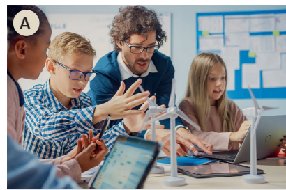
A der Lehrer, die Lehrerin