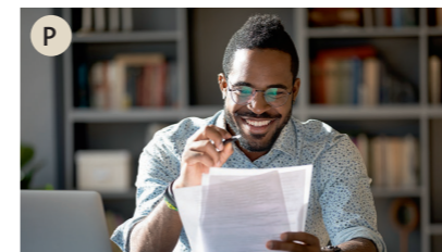
P der Schriftsteller, die Schriftstellerin