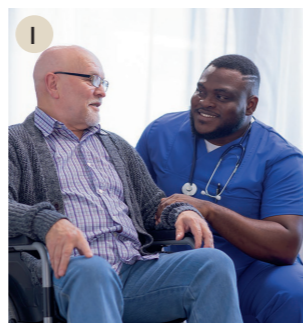
I der Pfleger, die Pflegerin