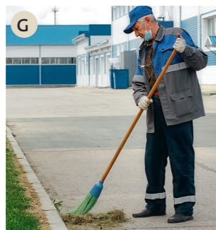
G der Hausmeister, die Hausmeisterin