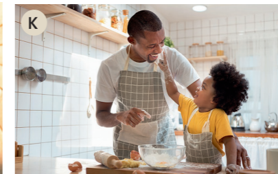
K der Hausmann, die Hausfrau