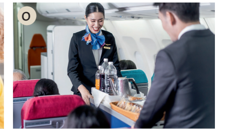
O der Steward, die Stewardess