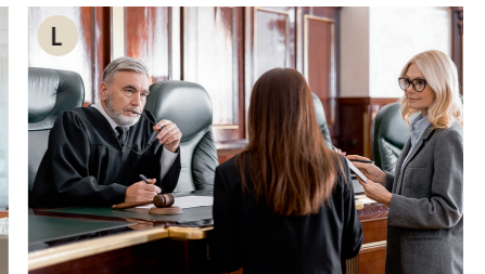
L der Richter, die Richterin