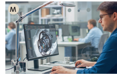
M der Ingenieur, die Ingenieurin