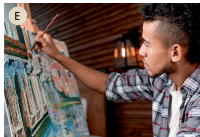
E der Maler, die Malerin