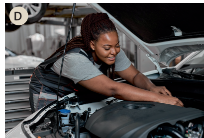
D der Mechaniker, die Mechanikerin