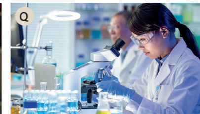
Q der Wissenschaftler, die Wissenschaftlerin