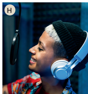
H der Musiker, die Musikerin