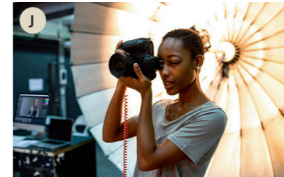
J der Fotograf, die Fotografin