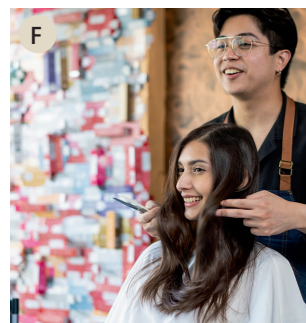
F der Friseur, die Friseurin