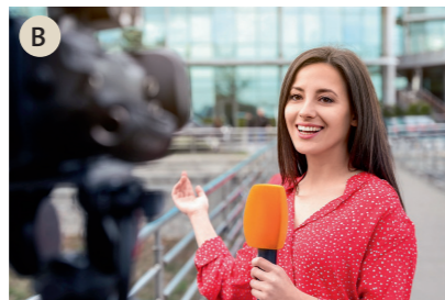
B der Reporter, die Reporterin