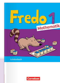
Fredo Ausgabe 2021

Wechsel von entdeckendem Lernen und automatisierten Üben