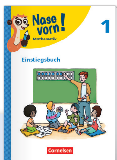
Nase vorn! Ausgabe 2022