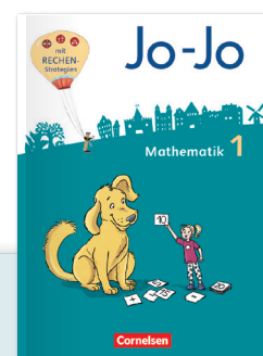
Jo-Jo Ausgabe 2018

Rechenstrategien mit speziellen Merkkarten (entwickelt von den Duden Instituten für Lerntherapie)