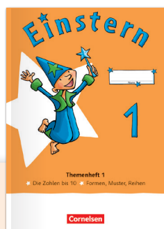
Einstern Ausgabe 2021

Themengemischte Hefte Selbstständiges Lernen im individuellen Tempo